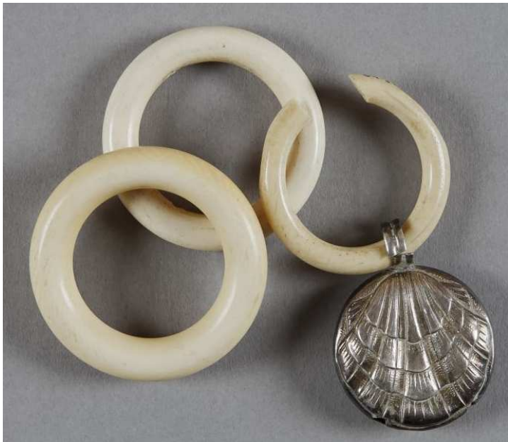
Un hochet de bébé