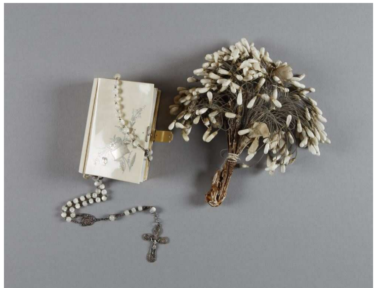
Un missel, un chapelet et un bouquet de communion.