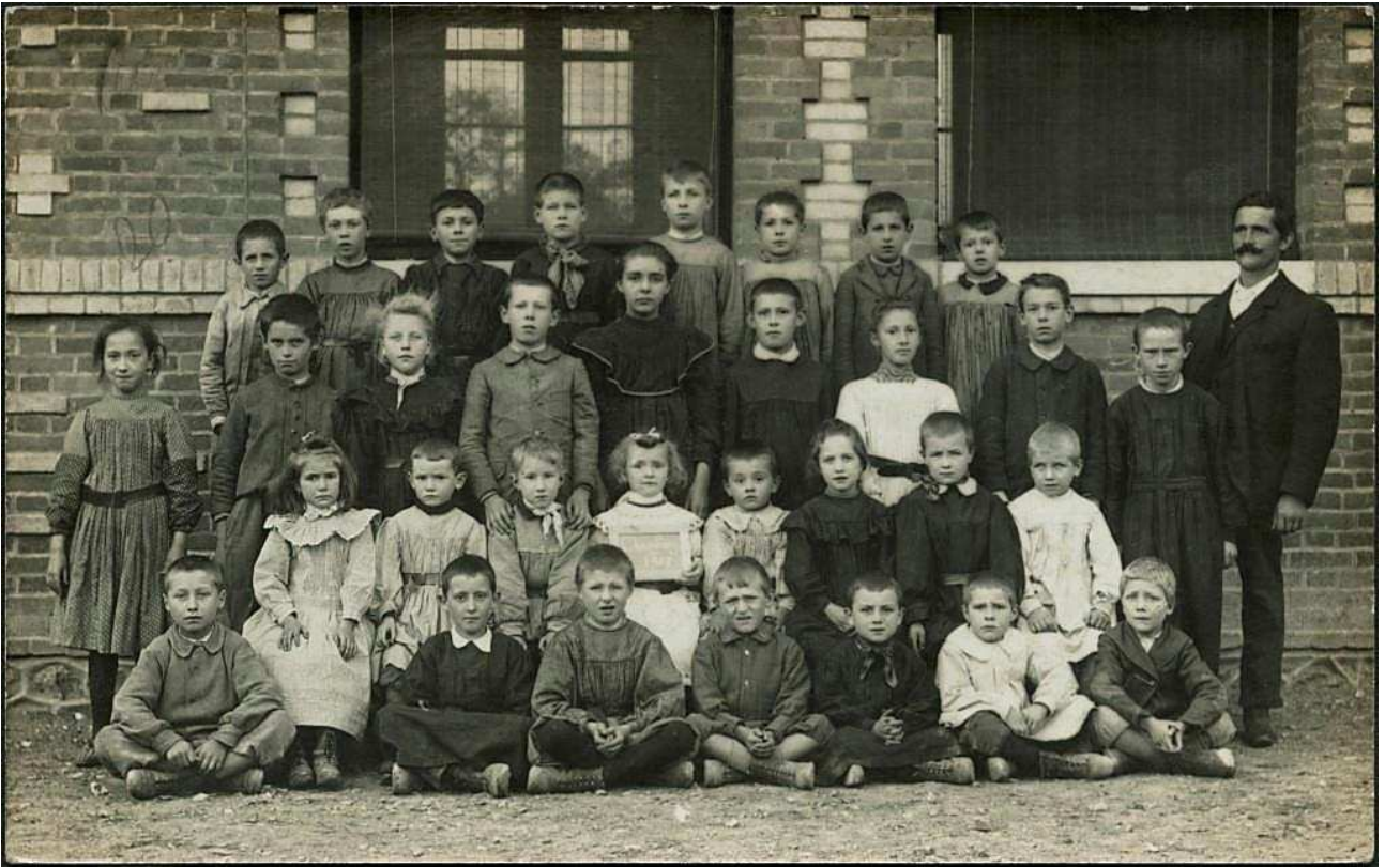
Une photo de classe autrefois.