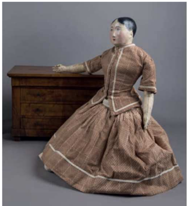
Une poupée ancienne