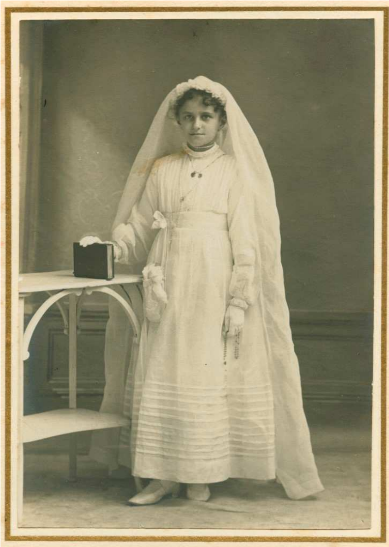
Jeune fille avec une robe et un voile de communion. Elle tient un missel et un chapelet.