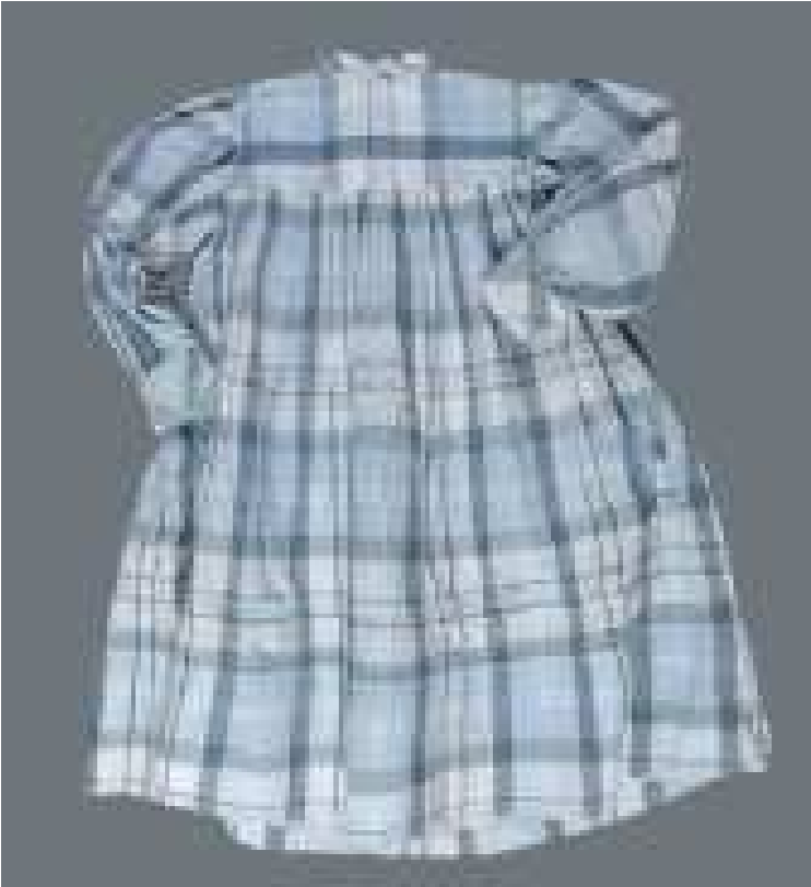
Une blouse d'écolier